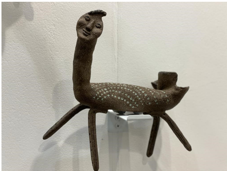
趙素蘭 人面草泥馬 27(H) x 27(L) x 12(D) cm 2018