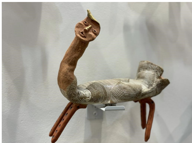
趙素蘭 人面草泥馬 27(H) x 27(L) x 12(D) cm 2018